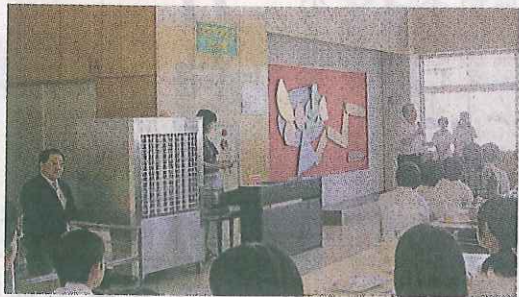
伊藤忠丸紅スチールAPが 販売する涼風装置を寄贈

伊藤忠丸紅鉄鋼は、 文部科学省の「東日本 大震災、子どもの学び 支援ポータルサイト」 を通じて岩沼市教育委